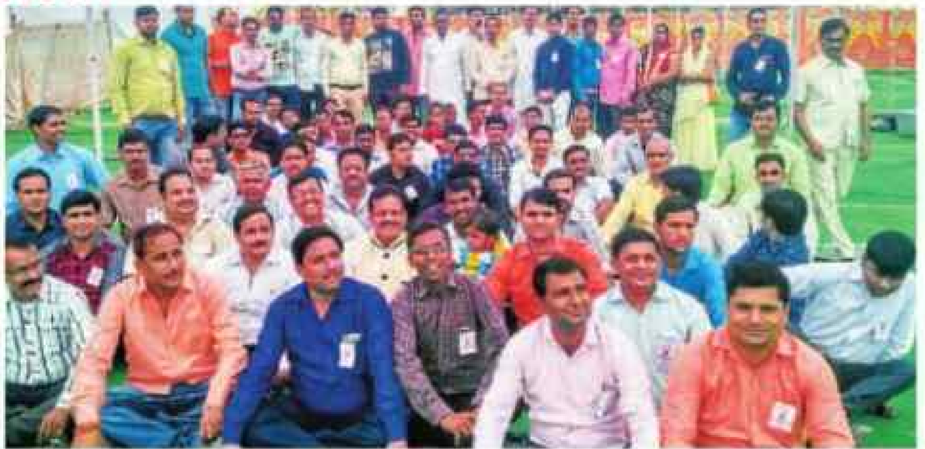
प्रांतीय अधिवेशन में शामिल हुए शिक्षकों का समूह।