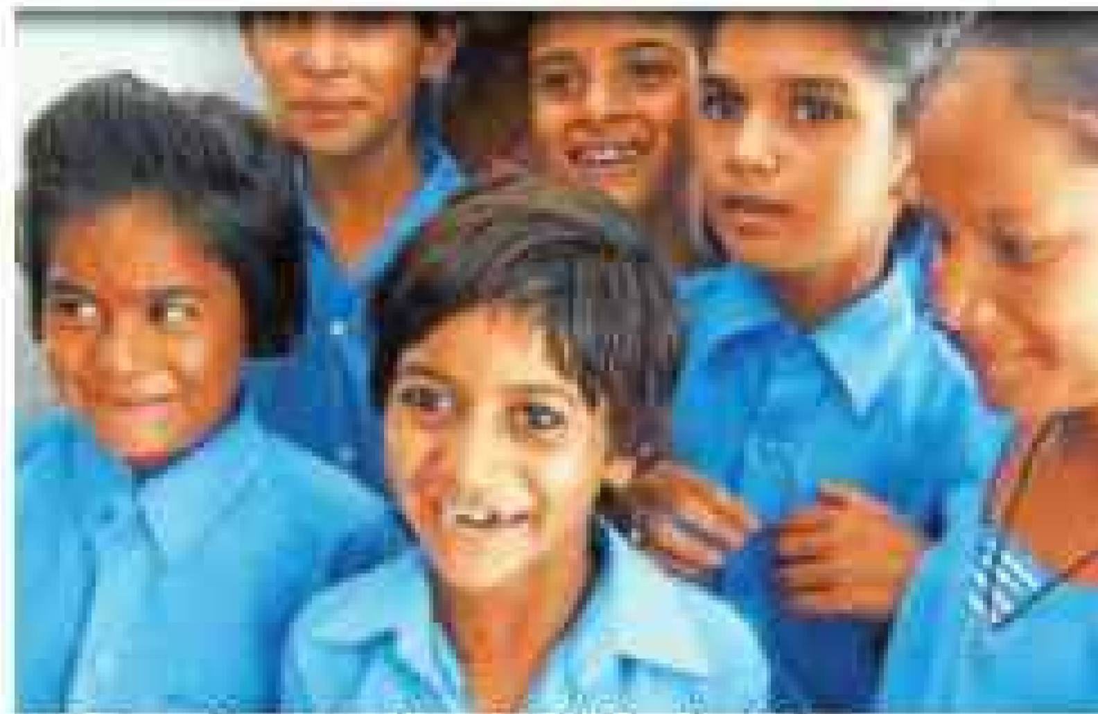
पांचवीं कक्षा में पढ़ने वाले विद्यार्थी बोर्ड की परीक्षा देंगे।

बीते वर्ष डाइट की ओर से पांचवीं की परीक्षा निम्न स्तर पर की गई थी लेकिन यह सरकारी स्कूलों तक ही सीमित था। इस साल पैटर्न बदल दिया गया है। प्राथमिक शिक्षा