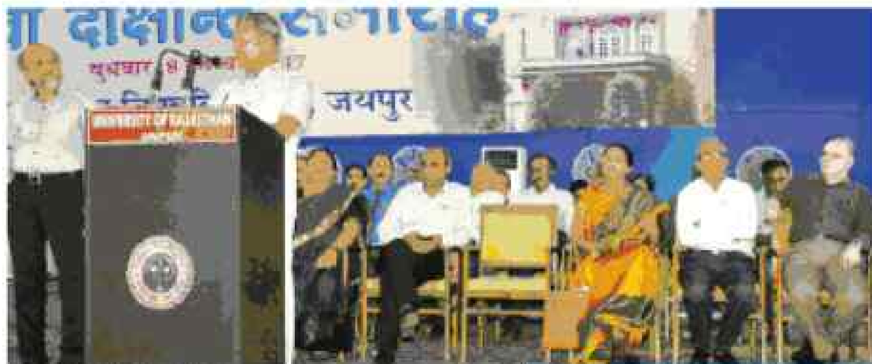
स्व. लो. नव ज्योति, जयपुर

5 नोडल केन्द्रों से मिलेगी पीएच.डी. डिग्रियां व गोल्ड मैडल