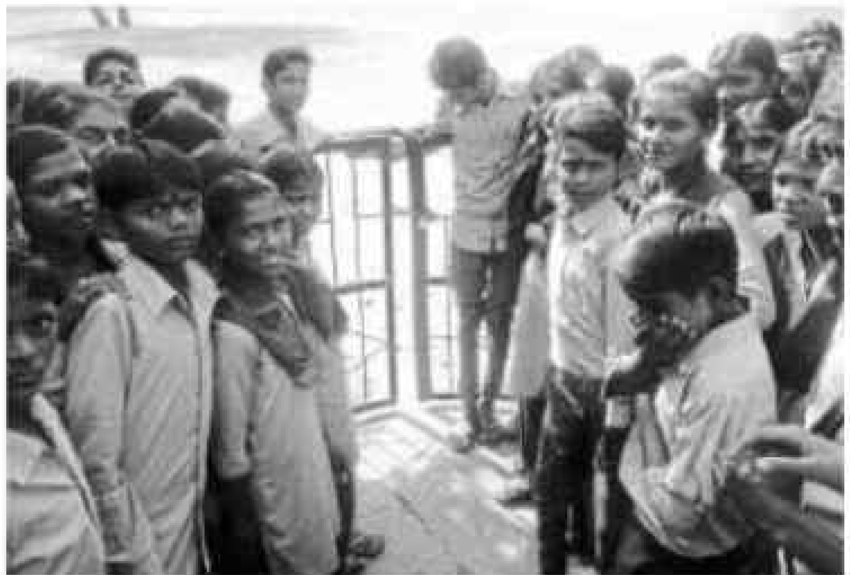
साबला. रामावि ओडा में ताला बंदी के साथ उपस्थित विद्यार्थी।