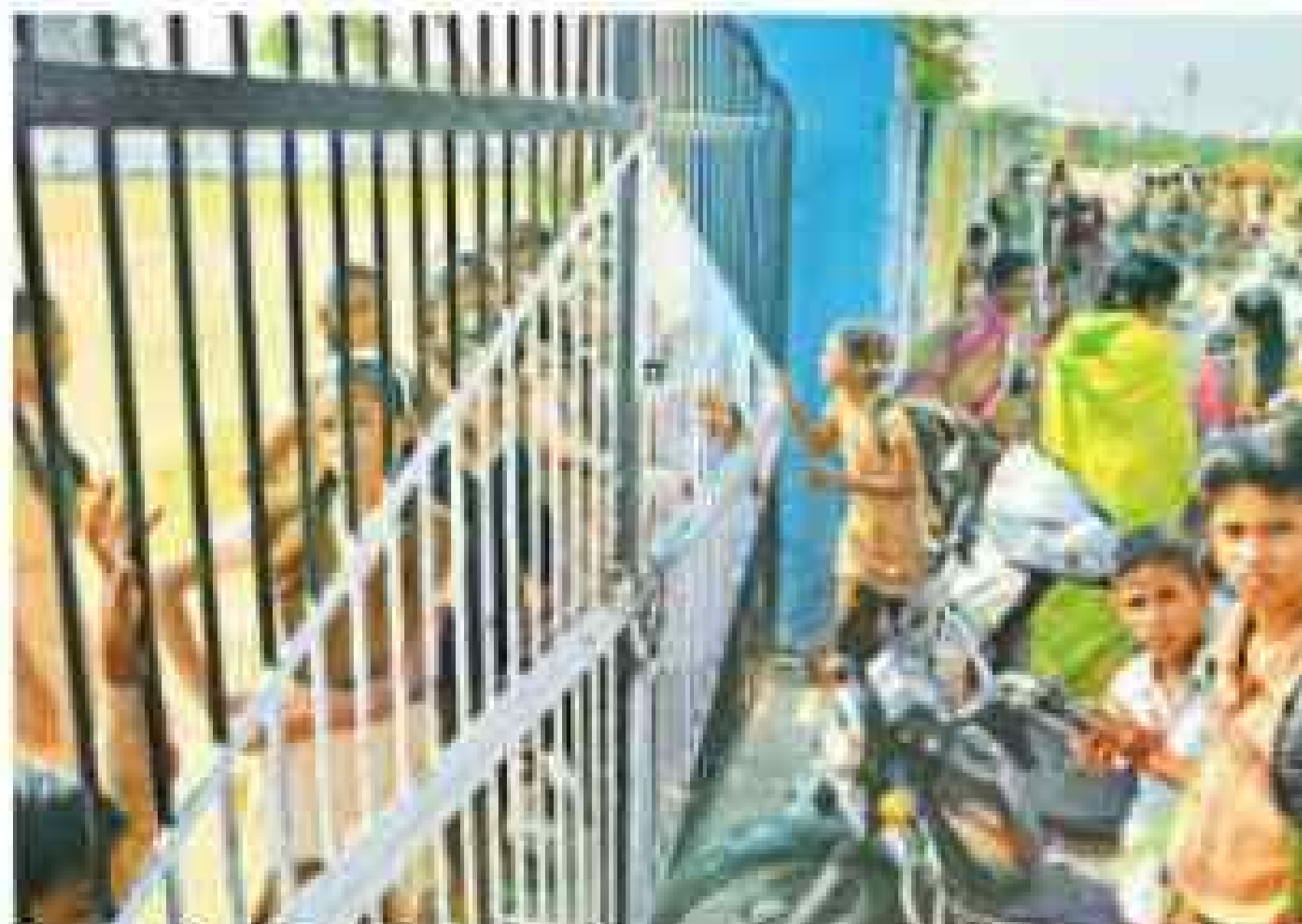
किशनावतों की खेड़ी स्थित राउमा विद्यालय में अध्यापकों की कमी को लेकर छात्र-छात्राओं ने तालाबंदी कर किया प्रदर्शन।