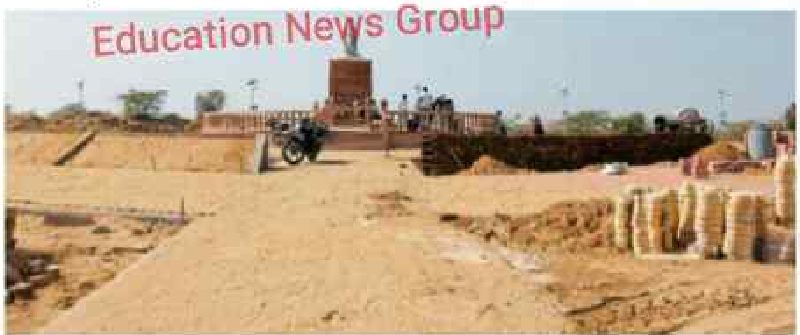
महाराजा गंगासिंह विश्वविद्यालय में तैयार होता स्वामी विवेकानंद पार्क।

इसमें स्वामी विवेकानंद की छह फीट की मूर्ति लगाई है। साथ ही पार्क को विस्तृत रूप भी दिया गया है। मूर्ति का अनावरण 28 नवंबर को होने वाले दीक्षांत समारोह में राज्यपाल करेंगे। राज्यपाल ने सभी विश्वविद्यालयों में स्वामी विवेकानंद की मूर्ति लगाने के निर्देश दिए थे, लेकिन विश्वविद्यालय प्रशासन ने इसके साथ ही विवेकानंद पार्क भी विकसित किया है। विद्यार्थी इस पार्क में स्वामी