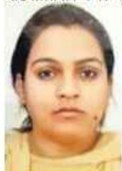
परीक्षा परिणाम घोषित नहीं होने पर परेशान हो रही छात्रा।

विद्यार्थियों ने बताया कि उसके परिजनों ने इस मामले में कई बार कॉलेज प्रशासन से बात की। इसके बाद प्रिंसीपल ने 17 जुलाई 2018