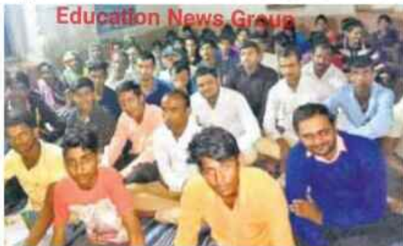
पाड़वा, ओड़ में एक्स्ट्रा क्लास के शुभारंभ पर मौजूद बच्चे और अभिभावक।