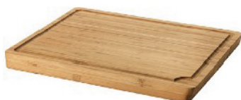
PLANCHE À DÉCOUPER

Choisissez une planche en bois plutôt que le plastique, qui serait davantage sujet aux risques de contamination.