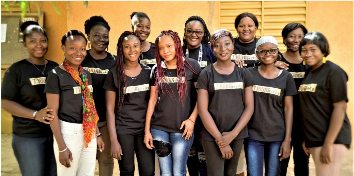
LES LAURÉATES DU BURKINA FASO / FESPACO – FÉVRIER 2019