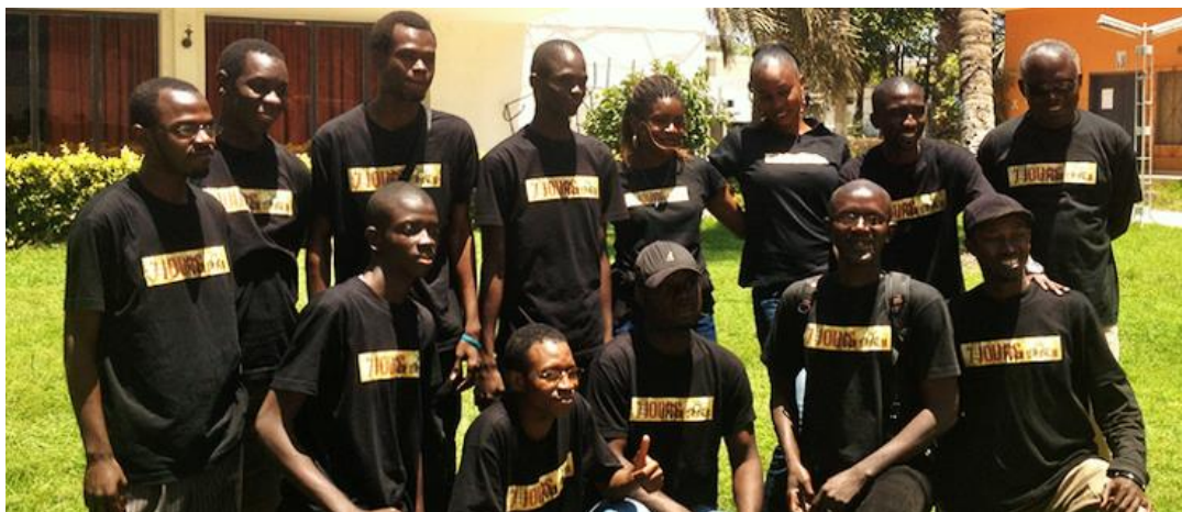
LES LAURÉATS DU SENEGAL / FESTIVAL IMAGE ET VIE 2012

Synopsis : A sa sortie de prison, un homme retrouve sa compagne pour tenter de refaire sa vie. Mais un petit garçon va soudain faire irruption dans sa vie. Le croyant abandonné, il va tout faire pour tenter de l'adopter. Cette démarche va lui permettre de retrouver son ancienne compagne qui lui fera une surprenante révélation qui bouleversera sa vie.