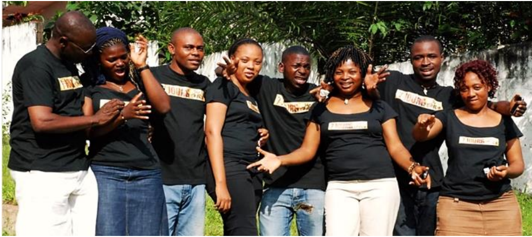
LES LAURÉATS DU CAMEROUN / FESTIVAL ECRANS NOIRS 2009