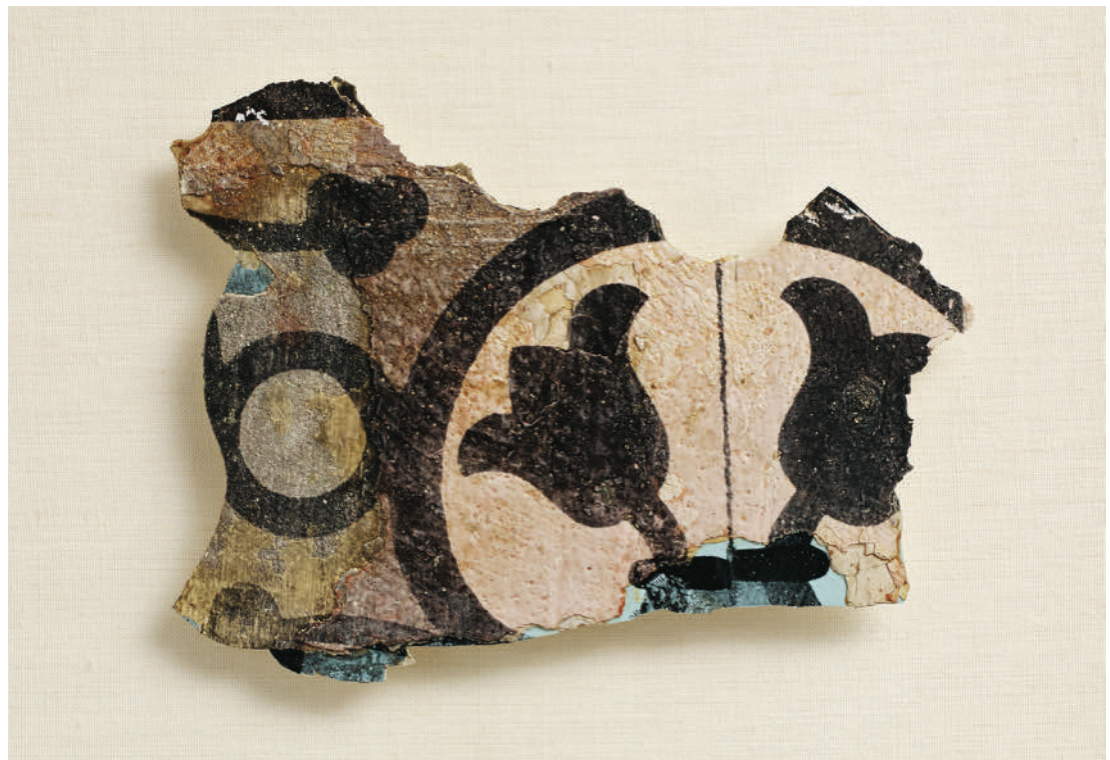
In tutte le pagine: 38 Days of Re-Collection , 2014, Steve Sabella. Negativi fotografici in bianco e nero (generati a partire da fotografie digitali), stampati con emulsione fotografica in bianco e nero applicata su frammenti di pittura a colori, raccolti dalle pareti delle case nella Città Vecchia di Gerusalemme. Le fotografie sono state scattate in una casa palestinese occupata dal 1948.