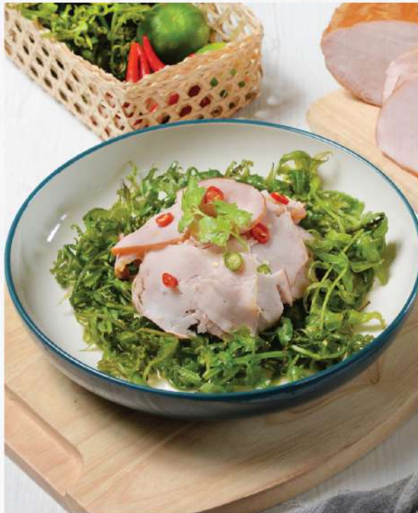
PB Signature Tasty Kassler Ham Salad with edible Fern. 240.-