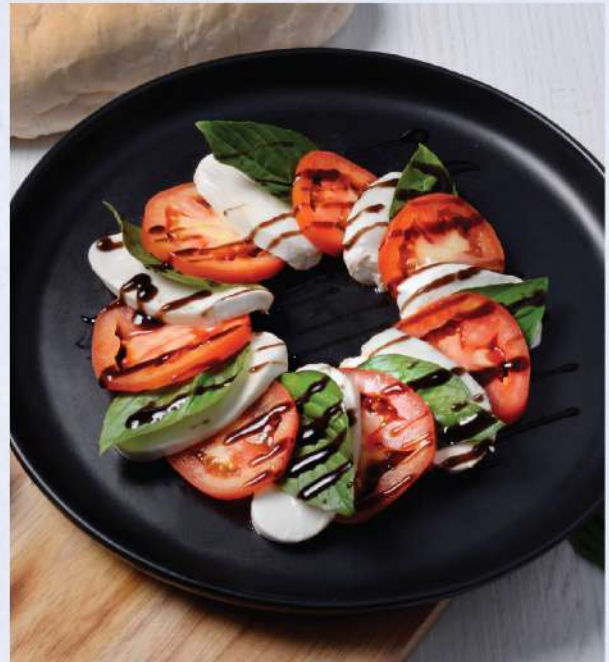
Tasty Tomato & Mozzarella Caprese. 280.-

แพลตเตอร์รวม พามาแฮม ซาลามี ชีส สไตส์สเปน Winemaker Suggestion: PB Khao Yai Rose