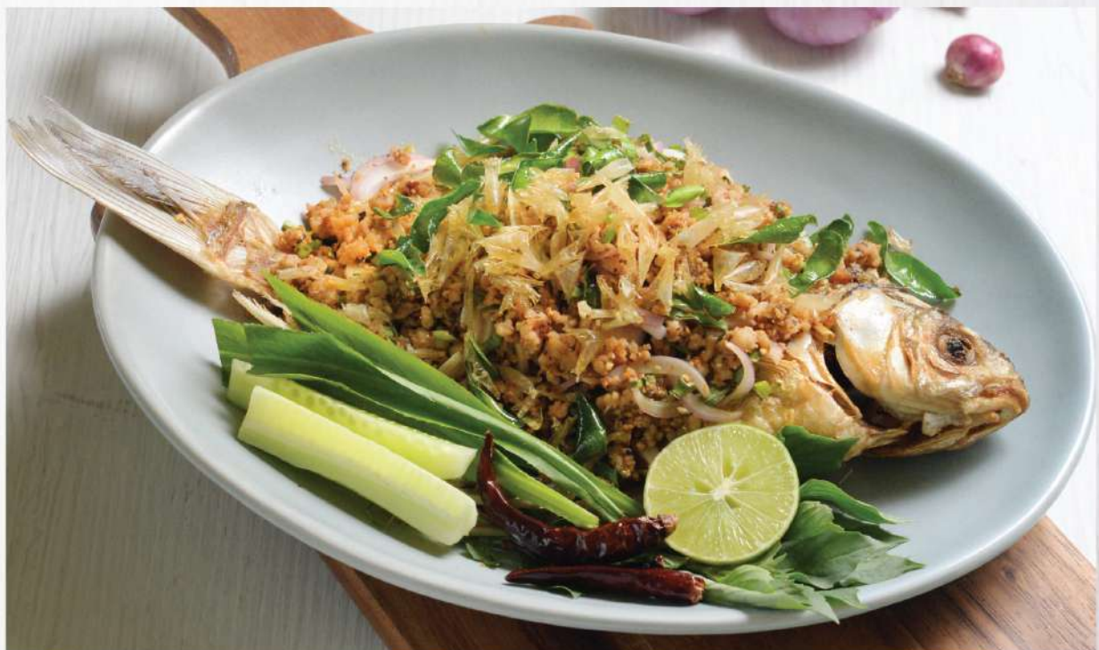
Spicy Northeastern Style flavored Fish Mince with aromatic Herbs. 420.-

Winemaker Suggestion: Geoff Hardy Sauvignon Blanc