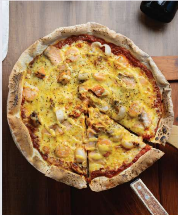
Seafood Supreme. 480.-

Winemaker Suggestion: PB Khao Yai Reserve Chenin Blanc