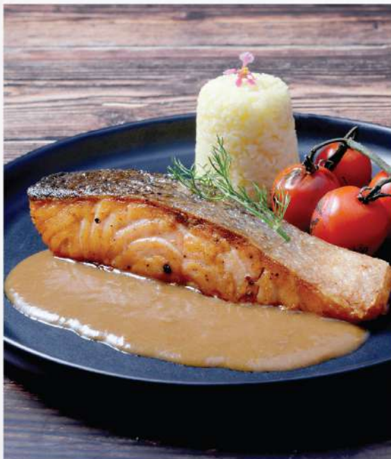
Pan-fried Salmon Steak with Lobster Sauce. 450.-