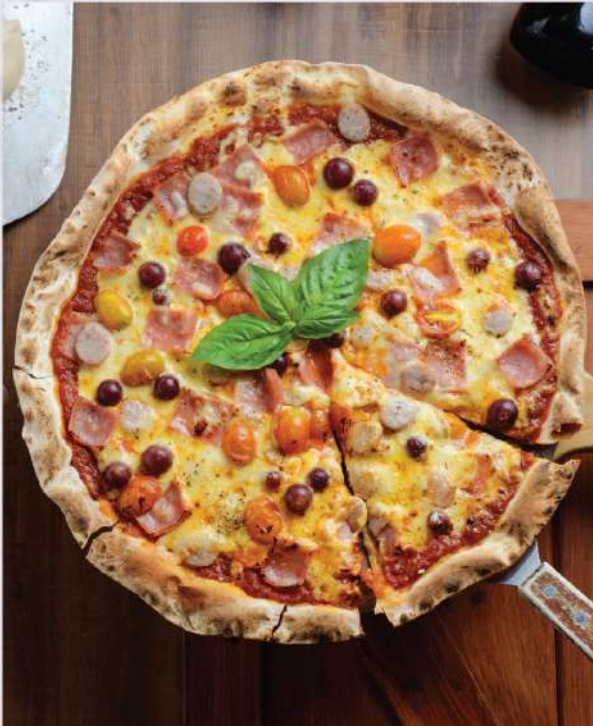
PB Special Pizza - Grape, Italian Sausage, Tomato, Ham, and Basil. 420.-