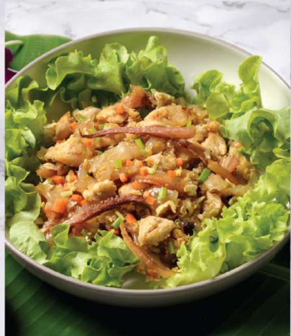
Stir-fried Flat Rice Noodles with Chicken and Egg. 220.-