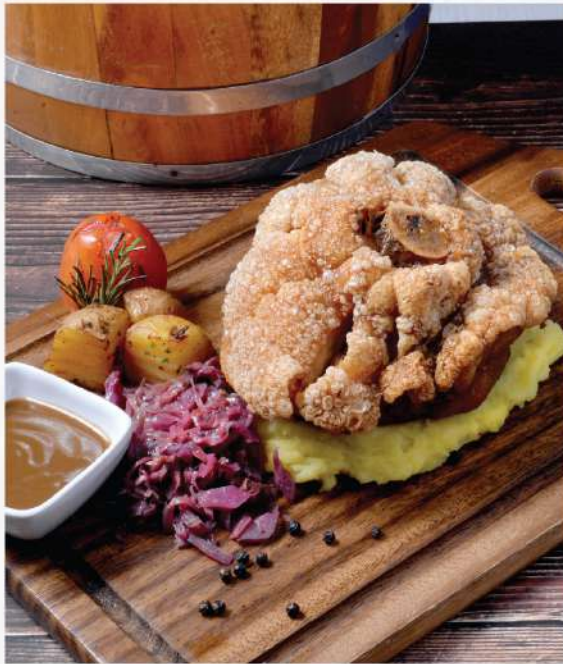
German Pork Knuckle. 550.-