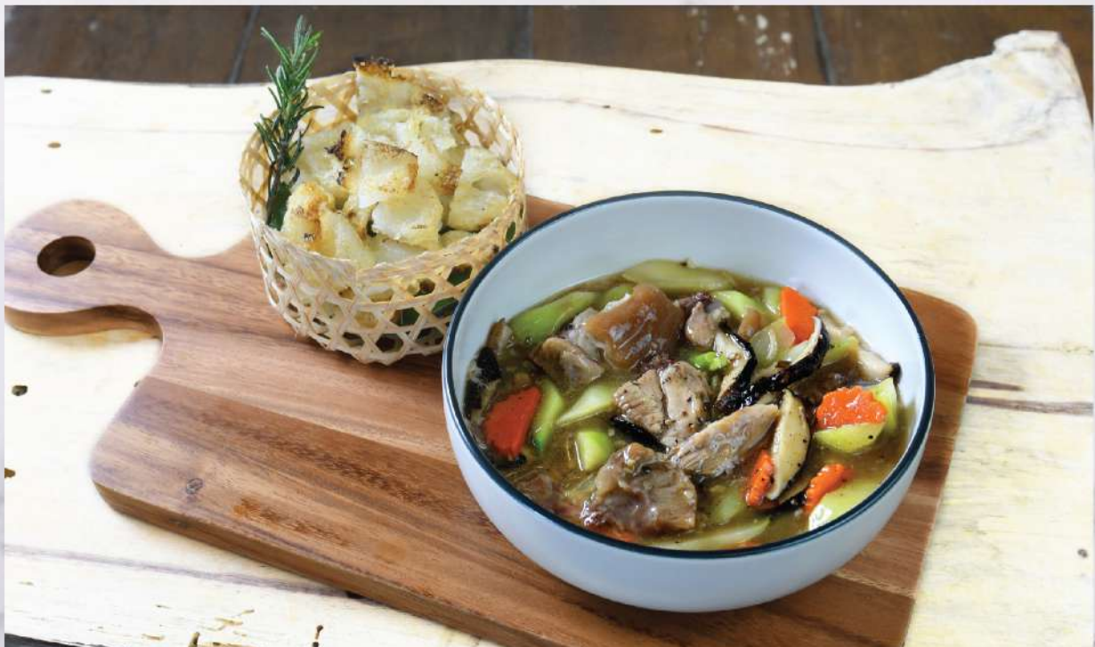
Pan-fried flat Rice Noodle with Chinese Style braised Pork / Beef Gravy. 220.-/240.-