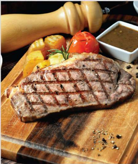
PB Strip Loin Steak, flame-grilled to your likeness, served with your choice of Sauces (250g) 950.-