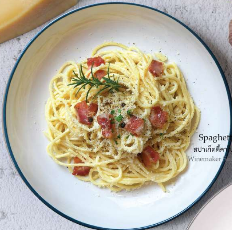
Spaghetti Carbonara. 280.-