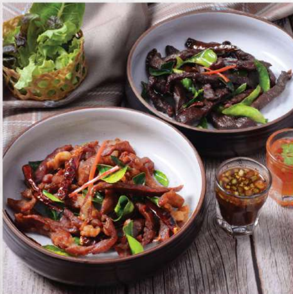
Homemade Jerky Style Deep-fried Fillet of Sun-Dried Pork / Beef. 220.-/240.- สันคอหมูแดดเดียว / เนื้อ Winemaker Suggestion: Singha Beer