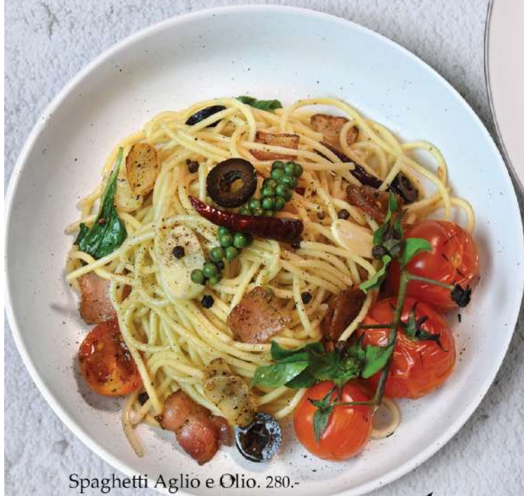
Spaghetti Aglio e Olio. 280.-

Winemaker Suggestion: Geoff Hardy Sauvignon Blanc