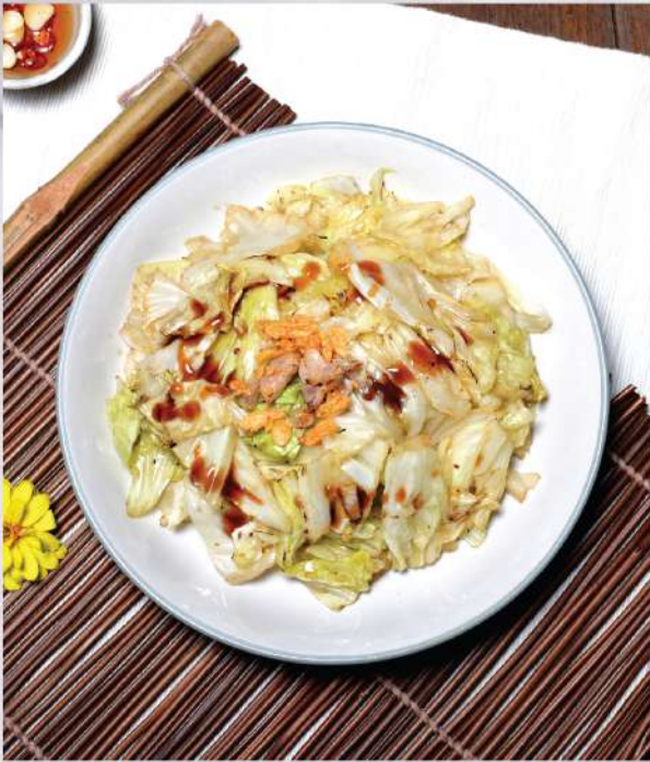
Tasty stir-fried Cabbages with Fish Sauce. 150.-