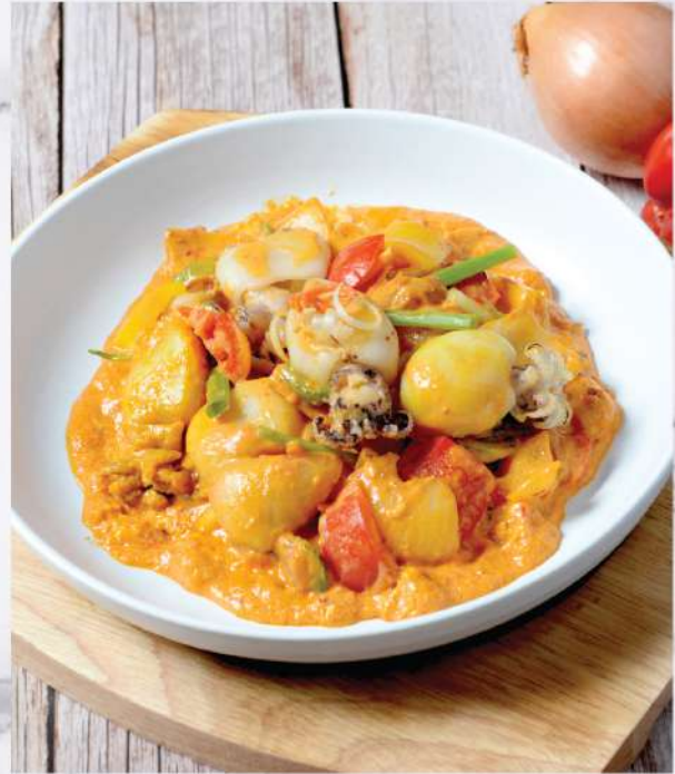
Stir-fried Calamari with Salted Egg York. 280.-

Winemaker Suggestion: PB Khao Yai Reserve Chenin Blanc