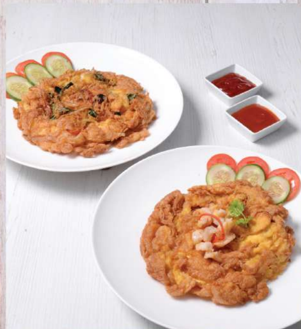
Thai Style Omelet with Prawn/Herbs. 220.-/180.-

Winemaker Suggestion: Geoff Hardy Sauvignon Blanc