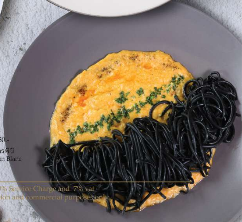
PB Squid Ink Spaghetti with Creamy Crab Sauce. 350.-

Winemaker Suggestion: Geoff Hardy Sauvignon Blanc