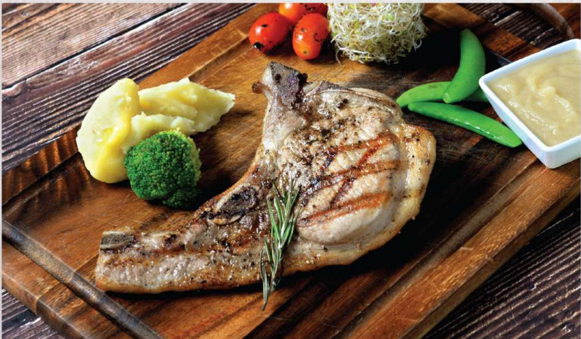
Flame-grilled Kurobuta Pork Chop with Apple Sauce. 490.-

Winemaker Suggestion: Geoff Hardy Red Meritage