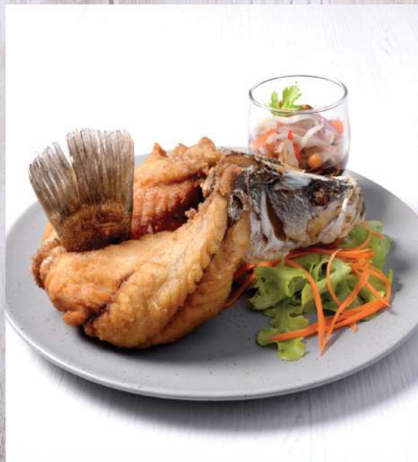
Deep-fried Fish Sauce flavored whole Seabass, served with tangy Green Mango Salad. 480.-

Winemaker Suggestion: Geoff Hardy Sauvignon Blanc