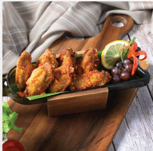
Deep-fried Chicken Wings with Salt and Sichuan Mala Spices. 200.- ปีกไก่ฉ่ำพริกเกลือหม่าล่า 🌶️ Winemaker Suggestion: Singha Beer