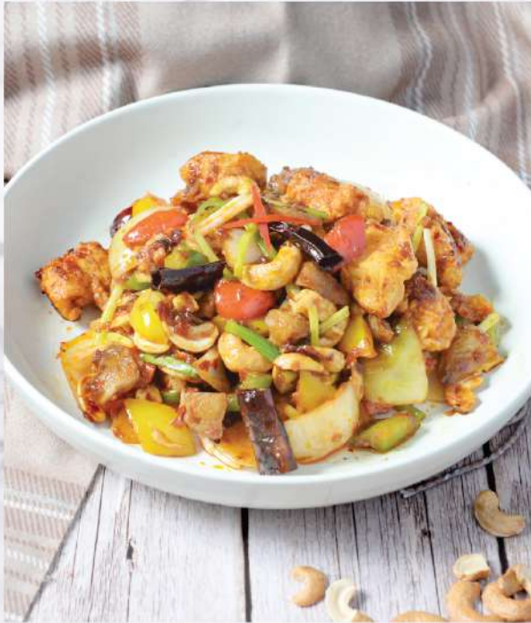
Stir-fried Chicken with Cashew Nuts. 240.-