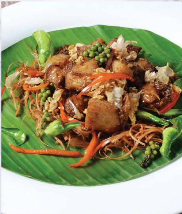
PB Fried special marinated Chicken with crunchy Lemon Grass and Kaffir Lime Leaf. 220.-

Winemaker Suggestion: PB Khao Yai Reserve Chenin Blanc