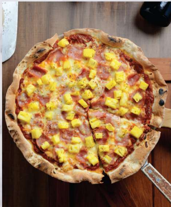
Hawaiian Pizza. 350.-

Winemaker Suggestion: PB Khao Yai Reserve Chenin Blanc