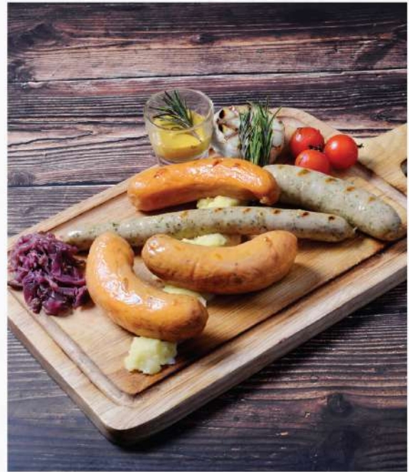
Grilled Sausages Platter. 450.-

ไส้กรอกเยอรมันรวมย่าง เสิร์ฟพร้อมซาว์เคราท์และมันบด