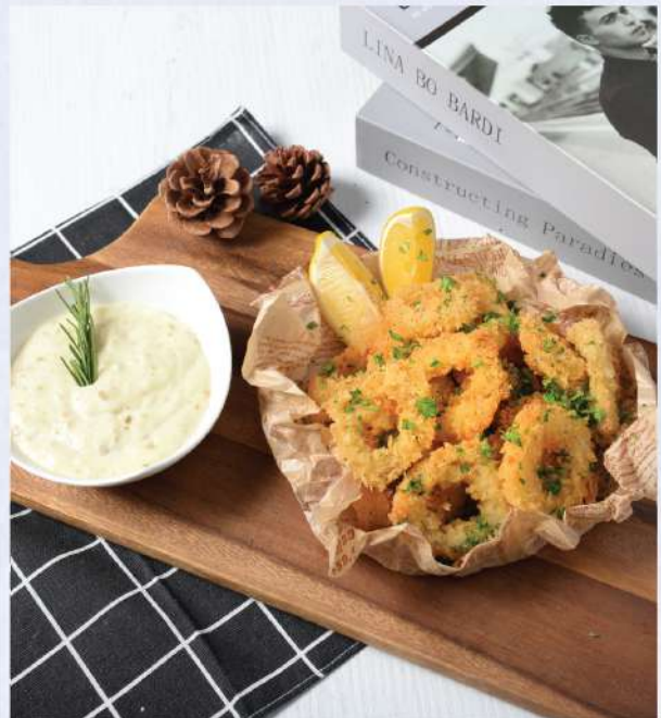
Beer-Battered Calamari, served with Garlic Cream Dip. 240.-

แซลมอนทาทากิ - แซลมอนเผาสะดึงไฟให้พอหอม ปรุงรสด้วยซอสพอนลีและหอมแดงแบบญี่ปุ่น Winemaker Suggestion: Geoff Hardy Sauvignon Blanc