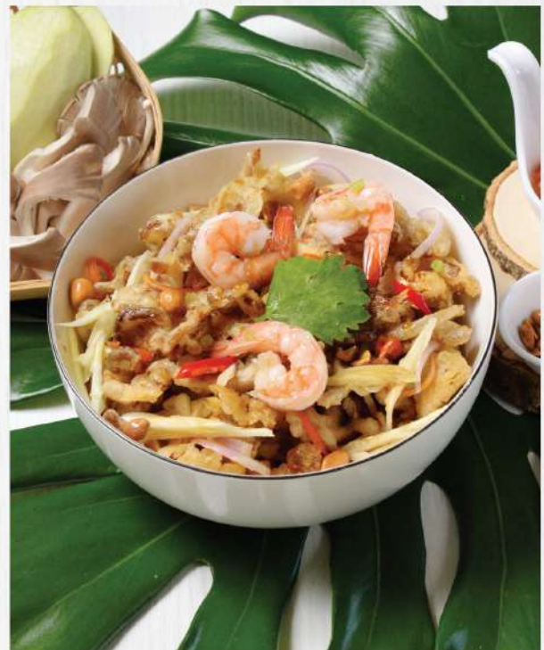
Beer-battered Oyster Mushroom served with a tangy Green Mango Salad and Prawn. 220.-

Winemaker Suggestion: Geoff Hardy Sauvignon Blanc