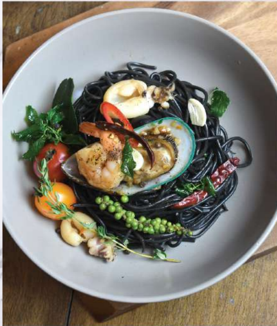
Tasty Thai Style stir-fried Squid Ink Spaghetti with Seafood and spicy aromatic Herbs. 280.-