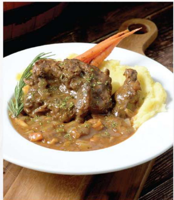
Red Wine Braised Beef Cheek Stew. 420.-

Winemaker Suggestion: Geoff Hardy Sauvignon Blanc