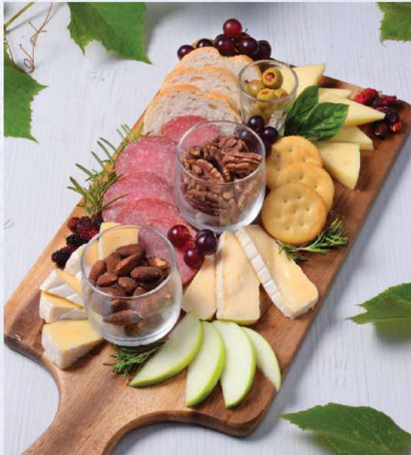
The Spanish Platter. 550.-

แพลตเตอร์รวม พามาแฮม ซาลามี ชีส สไตส์สเปน Winemaker Suggestion: PB Khao Yai Rose