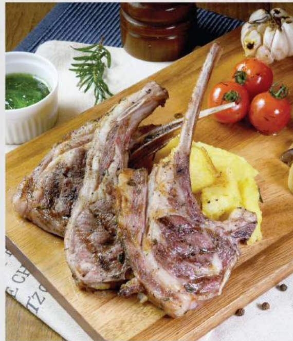
Home-style Grilled Rack of Lamb. 1,150.-

Winemaker Suggestion: PB Khao Yai Reserve Shiraz