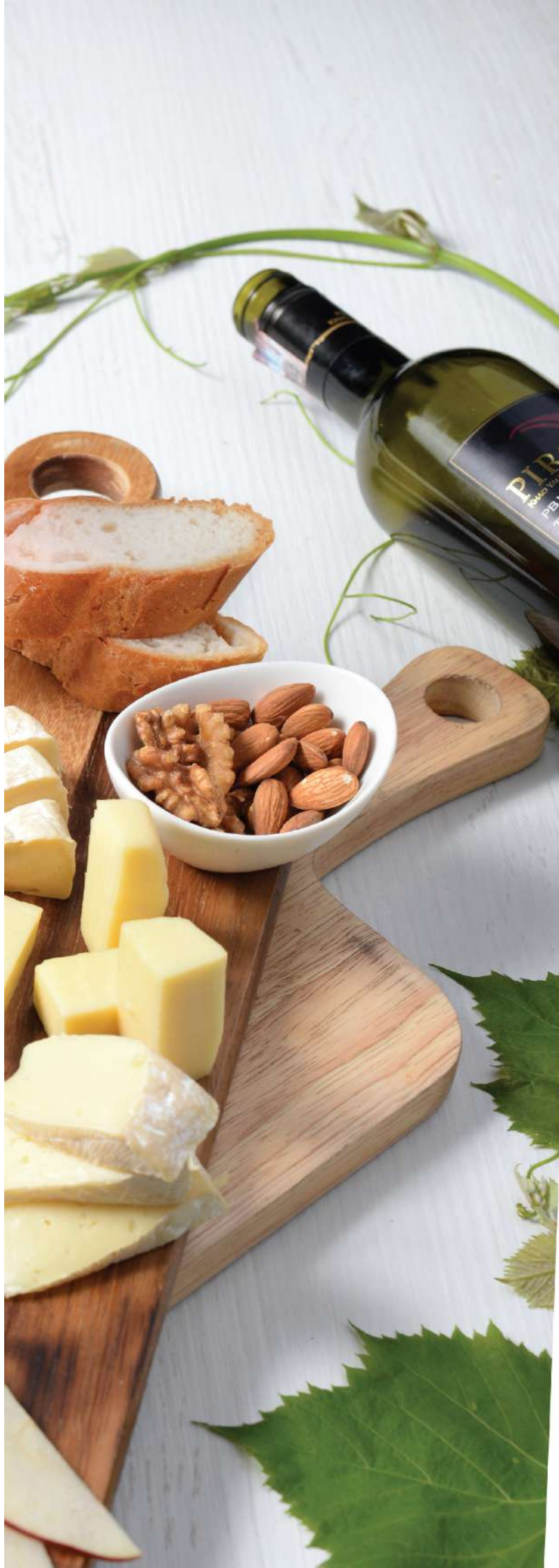
PB Valley Khao Yai Winery Est.1989