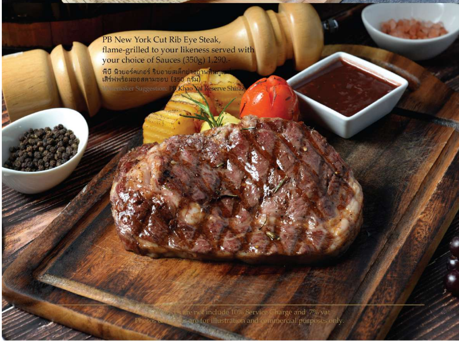
PB New York Cut Rib Eye Steak, flame-grilled to your likeness served with your choice of Sauces (350g) 1,290.-

พีบี นิวยอร์กคัทเรย์ สเต็กย่างไฟแรงเสิร์ฟด้วย เครื่องปรุงรสตามชอบ (350 กรัม) Winemaker Suggestion: PB Khao Yai Reserve Shiraz