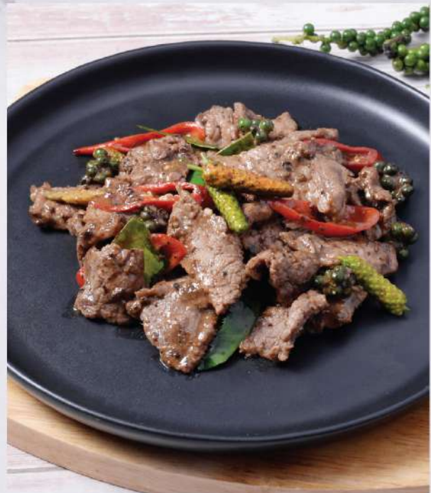
Drinker's favorite Peppery & Spicy Pork / Beef on a Sizzling Plate. 260.-