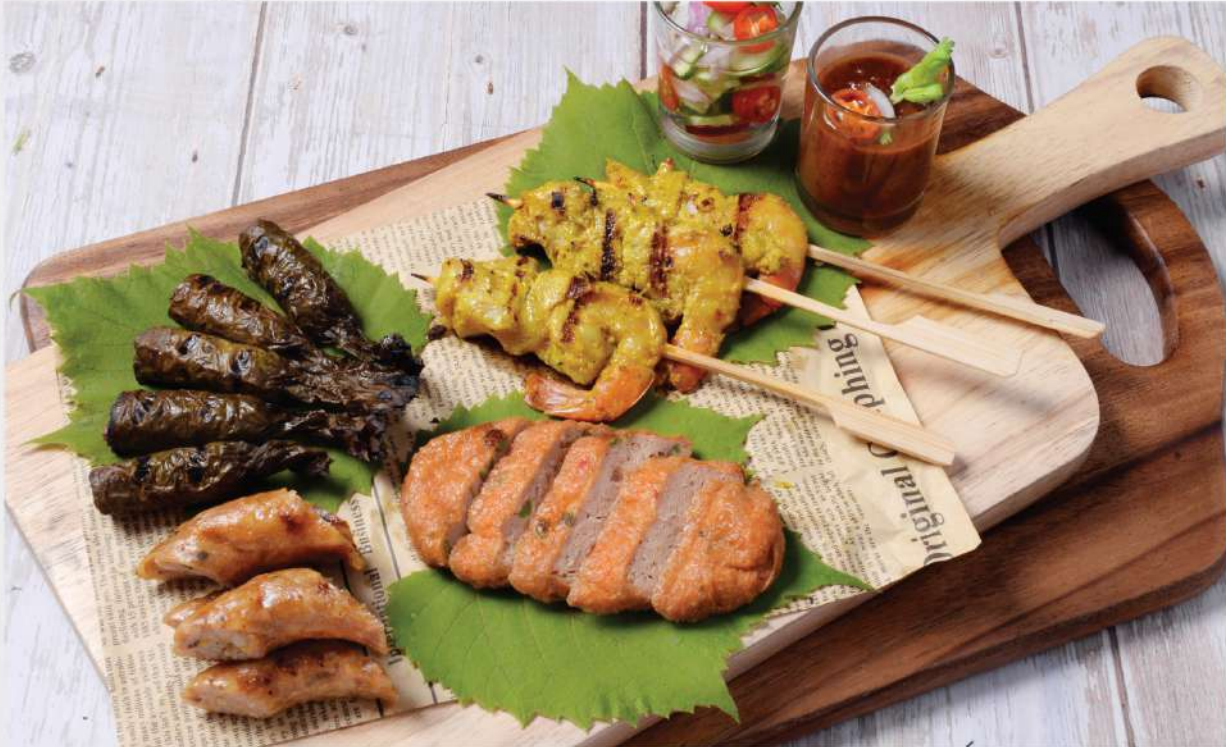
PB Thai Platter - Combination of Northern Style Sausages, Chicken and Prawn Satay Sticks, Grilled Grape Leaves stuffed with Beef and Fish Cakes. 320.- ชุดอาหารทานเล่น สไตส์ฟิปปี้ – ไส้อั่ว, ไก่และกุ้งสะเต๊ะ, ใบองุ่นหั่นเนื้อย่างและทอดมันปลา Winemaker Suggestion: PB Khao Yai Rose