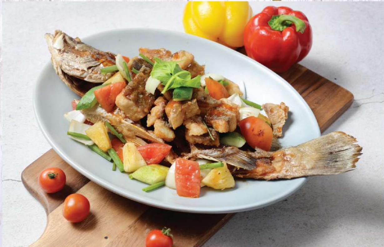
Deep-fried Whole Seabass with Sweet & Sour Sauce. 480.-