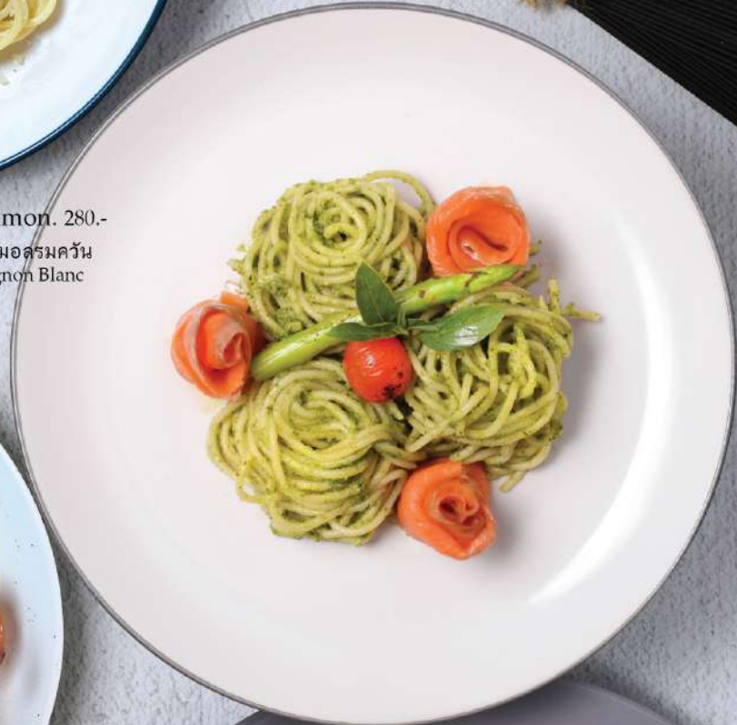
Spaghetti Pesto with Smoked Salmon. 280.-

Winemaker Suggestion: PB Khaoyai Reserve Chenin Blanc