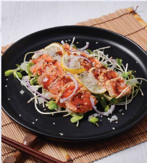
Salmon Tataki. 320.-

ชีสมอสซาเรลล่าสด เลิฟพร้อมมะเขือเทศ, โหระพาอิตาเลียน และบัลซามิคเข้มข้น Winemaker Suggestion: Geoff Hardy Sauvignon Blanc